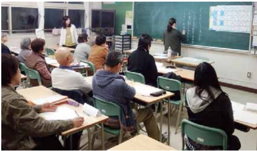
「しりとりにゲーム」に挑戦

ています。「スポーツが好き」「野球観戦が趣味」「おいしいものを食べるのが好き」など、受講生それぞれの個性も分ってきました。受講生同士、また