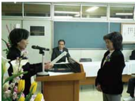
左上⇨卒業証書の授受 左下⇨卒業記念ハッピーのよつす 右下⇨入学式の様子

札幌遠友塾自主夜間中学は、ボランティア・スタッフが運営している自主夜間中学です。 1990年から、さまざまな理由で義務教育を十分受けていない400人以上の人たちが、励まし、支えあいながら学んできました。2009年4月からは、皆様のおかげで長年の夢がかない、札幌市立向陵中学校の教室を借りて授業ができるようになりました。毎週水曜日の夜6時から授業を行なっています。