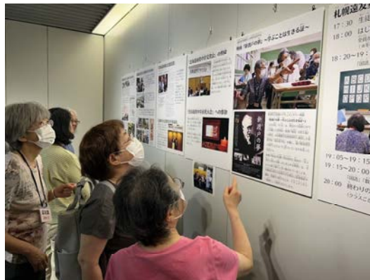
けいじしりょうえつらん ＜ 掲示資料閲覧 ＞