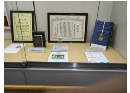
かくしゅひょうしょうじょう ＜ 各種表彰状 ＞