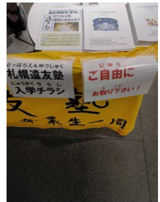
ちらし さっしるい ＜ チラシ、冊子類 ＞