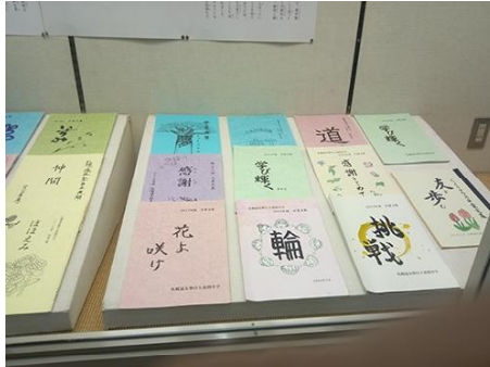
そつぎょうぶんしゅう ＜ 卒業文集 ＞