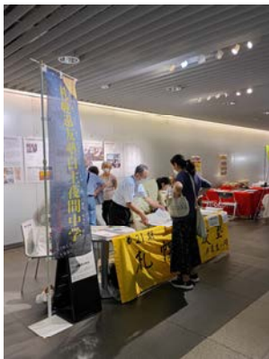
すたっふせつめい ＜ スタッフが説明 ＞

かでのる2・7での展示に続き、札幌駅前通地下広場（チカホ）にて9月5、6日にPR活動を行いました。展示資料を見て頂き、新規の受講生、スタッフの希望もありました。受講生さん、スタッフ、同窓生、賛助会員、議員の方や教育委員会関係の方、友人、知人と、多くの方が立ち寄ってくれました。中には飲み物や、お菓子を差し入れた方もおりました。感謝です。手応えを感じた2日間でした。