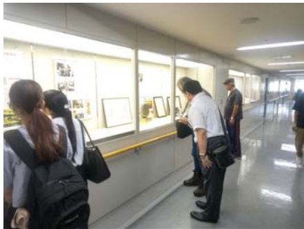
えつらんふうけい ＜ 閲覧風景 ＞

「札幌遠友塾創設35周年」にあたり、8月の1ヵ月間、かでのる2・7にて「札幌遠友塾35年間」の足跡の展示を実施しました。各種写真、卒業文集、教科の教材、年表、各種表彰状（人権賞：札幌弁護士会、社会貢献者表彰：社会貢献支援財団、北海道新聞社文化賞）など、多くの資料を公開しました。また、ドキュメンタリー映画「新渡戸の夢（札幌遠友塾が30分の映像）」がテレビモニターで随時上映され、多くの方に札幌遠友塾を知っていただくことができました。