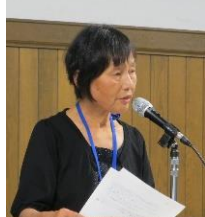
釧路くるかい代表報告