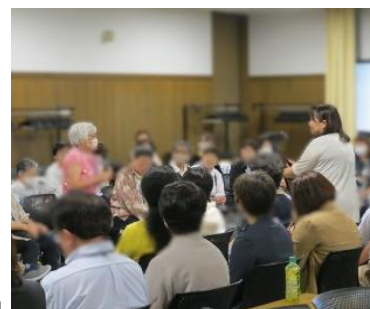
「交流会」での自己紹介の様子