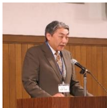
函館遠友塾代表報告