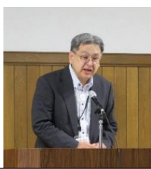
星友館中学校長挨拶