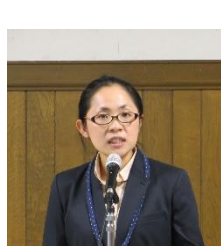
遠友塾スタッフ発表