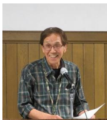
遠友塾受講生発表