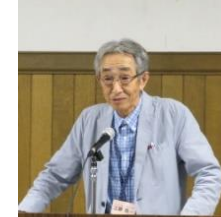
北海道に夜間中学をつくる会共同代表報告