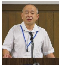
旭川つくる会代表報告